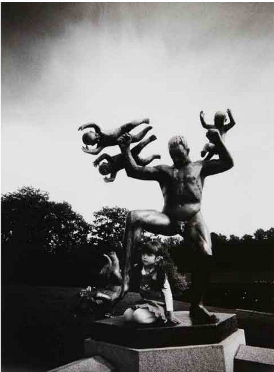
Oslo, 2007/2010. Silver-gelatin print, 40,8 x 30,1 cm.